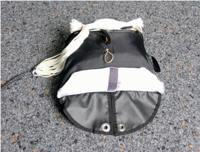
15. Hilfsschirm einrollen.