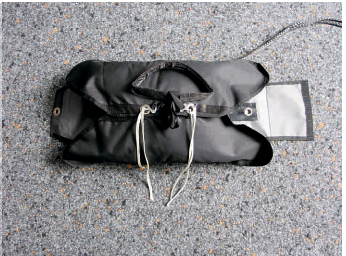
2. Mit Hilfe zweier Packschnüre die beiden seitlichen Verschlussklappen schließen und mit den Splinten des Auslösegriffes provisorisch sichern.