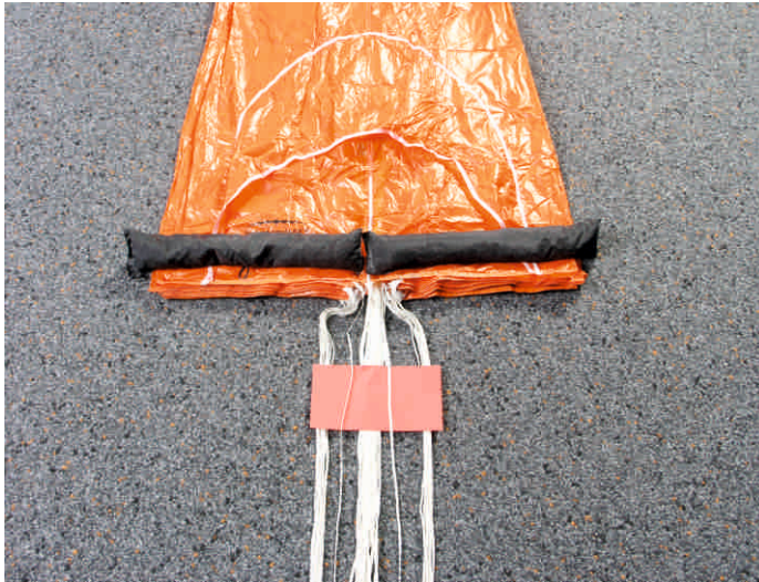
7. Fangleinen 1 und 20 (Piccolo und Annular EVO 20) und Mittelleinen auf kreuzungsfreien Verlauf kontrollieren. (Annular EVO 22/22HG: 1 und 22; Annular EVO 24/24HG: 1 und 24; Annular EVO Tandem/ Tandem HG: 1 und 30)