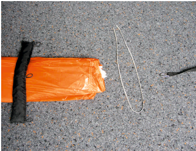
9. Packschnur entfernen!