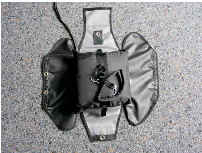
1. Auslösegriff in der mittleren Schlaufe des Innencontainers einschlaufen. Verbindungsleine an der gewünschten Seite aus dem Außencontainer herauslaufen lassen.