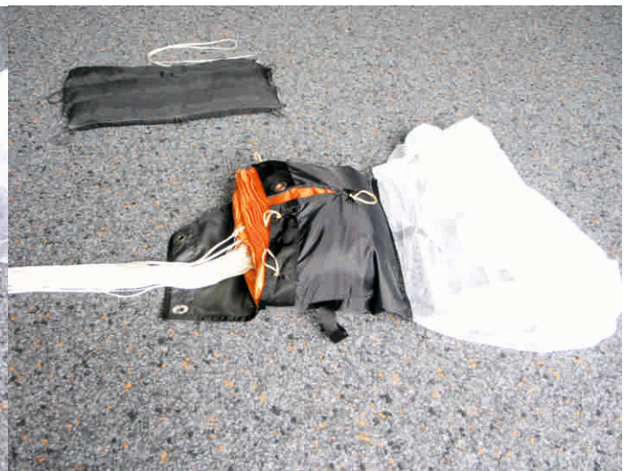
12. S-Schläge in den Innencontainer einlegen.