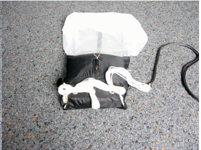
14. Innencontainer mit den Fangleinen verschließen. Zuerst die Mitte, dann Außen. Die letzten 30 cm der Fangleinen werden zum verschließen des Hilfsschirmes verwendet.