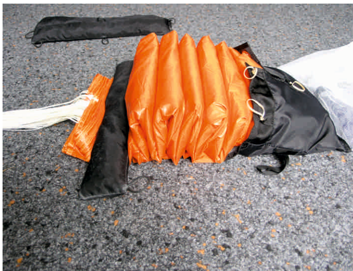
11. Restliche Kappe in kleinen S-Schlägen vor den Innencontainer legen.