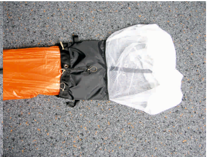
10. Oberes Kappenende in den Innencontainer einlegen.