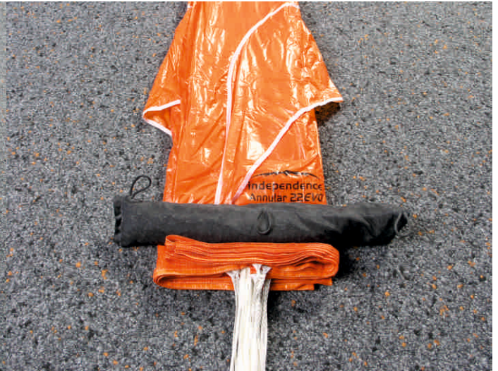
8. Basis S-förmig einschlagen und die RAM Air Pockets seitlich etwas herausziehen.