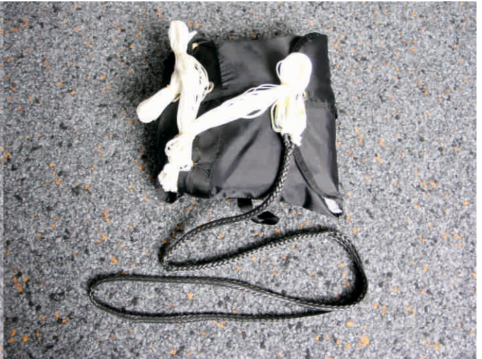
16. Klappen des Hilfsschirmes mit den restlichen Fangleinen verschließen.