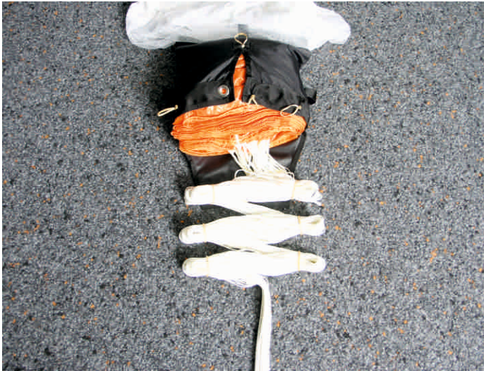
13. Fangleinen in 3x3 Achterschlägen bündeln. Die letzten ca 60 cm Fangleinen nicht bündeln. Achtung es müssen bei jedem Packen sowohl für die Fangleinen als auch für den Innencontainer immer neue Gummibänder verwendet werden!